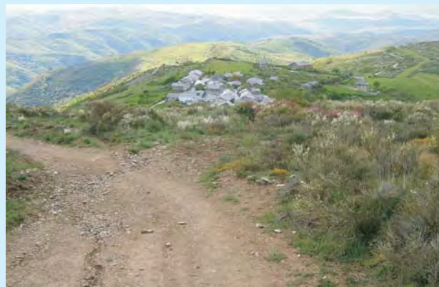
Górska droga do uspiętego jeszcze miasteczka