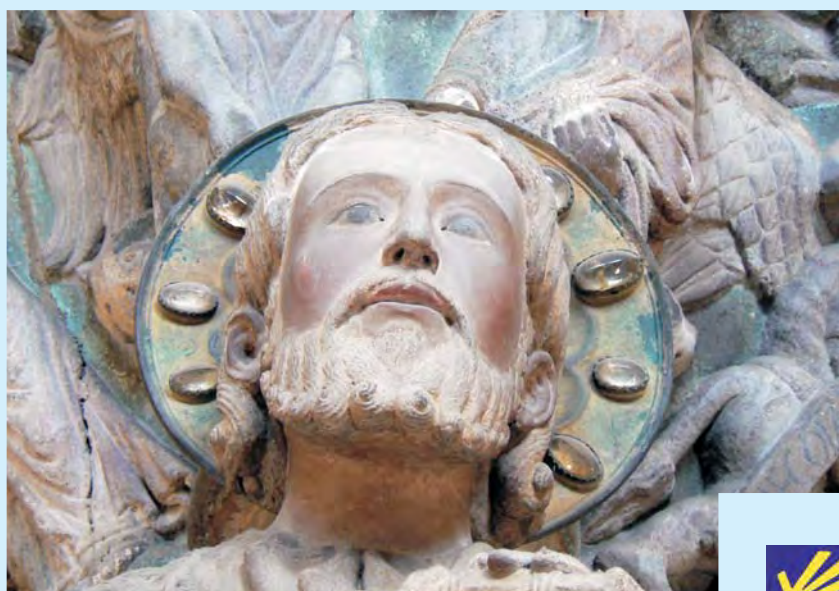
Santiago de Compostela – św. Jakub w Portyku Chwały Mistrza Mateo