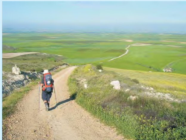
Droga prowadzi nas dalej niż widoczny horyzont

A dróg wiodących do Santiago było kilka. Droga Pierwotna prowadząca z Oviedo, stolicy Asturii do Santiago; Droga Angielska przez kanał La Manche; tzw. Szlak Arousa – trasa hipotetycznej drogi, którą przewieziono ciało Apostoła z Jerozolimy do Hiszpanii, w której prowadził on działalność misyjną. Na przełomie XV/XVI w. po upadku ostatniego islamskiego ośrodka władzy w Grenadzie, powstała Droga Srebrna – Via de La Plata . Ale największe znaczenie, od XI w. miała i ma nadal tzw. Droga Francuzów ( Camino Francés ).