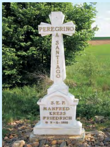
Pielgrzymie krzyże tych, co pozostali na Drodze