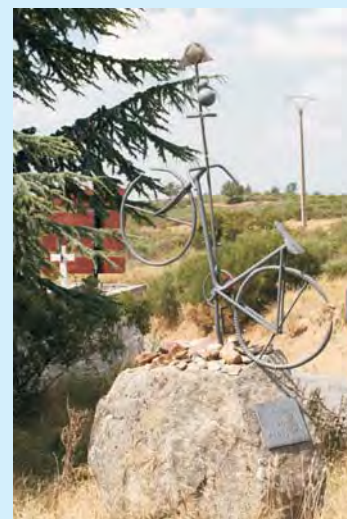
Nie wszystkim udało się dotrzeć do celu...