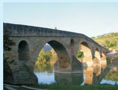
Średniowieczne mosty budowano, aby ułatwić drogę pielgrzymom. Najśłynniejszym jest ten w Puente la Reina

„Tu przybywali z Francji, z Włoch, z Europy Środkowej, z krajów nordyckich i z narodów słowiańskich chrześcijanie wszelkich stanów: od królów aż po najskromniejszych wieśniaków, chrześcijanie wszystkich poziomów duchowych: od świętych, jak Franciszek z Asyżu czy Brygida Szwedzka (nie mówiąc o tylu świętych hiszpańskich), aż po publicznych grzeszników, czyniących pokutę.