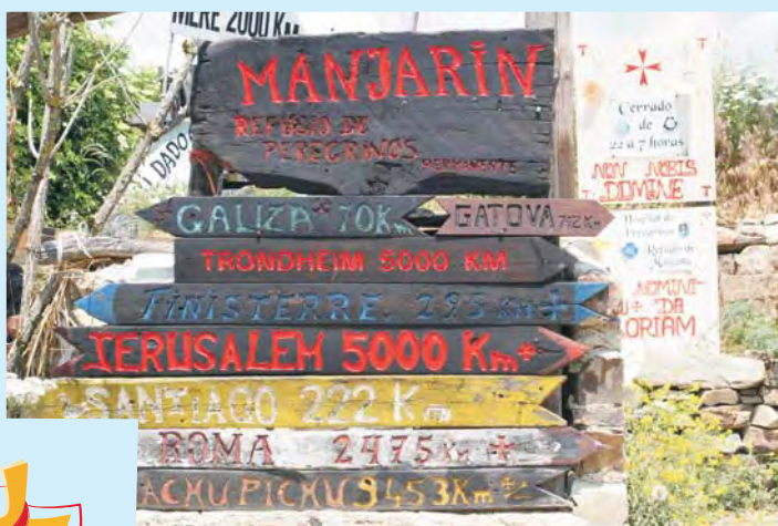
Do świętych miejsc wiele kilometrów, a do Santiago już tak blisko