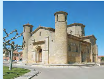
Fromista – wzór architektury romańskiej – połączenie prostoty i bogactwa form

Szlaki wiodące do Santiago opowiadają nam o pasji podróżowania oraz o dziełach powstałych w wyniku kulturalnej i religijnej przygody, jaką było pielgrzymowanie, nieograniczone poprzez granice państwowe, marzenia wyrażone przez mnichów w odległych klasztorach, w dziełach, które mówią nam o rozwoju