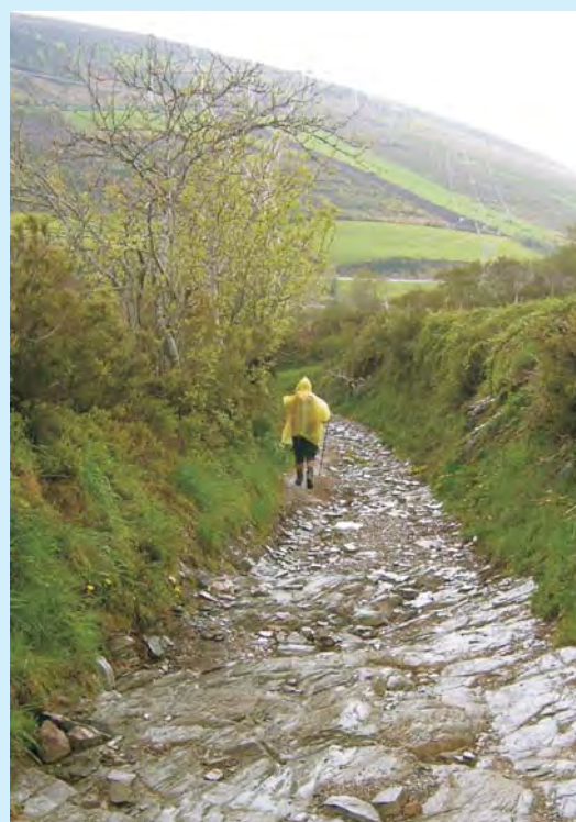
Często droga do celu jest wyboista