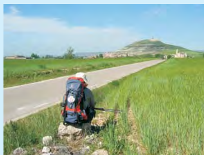
Chwila wytchnienia i zadumy