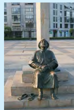
Pomnik średniowiecznego pielgrzyma w Leon