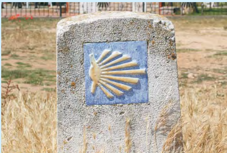
Kamienny drogowkaz z muszlą św. Jakuba wyznaczający kierunek drogi