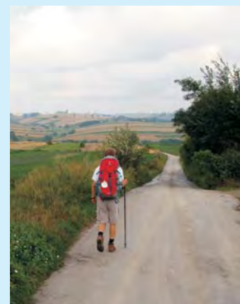
W drodze z Małopolski do Santiago

Kościół pw. św. Jakuba Apostoła Starszego oraz trasa Małopolskiej Drogi św. Jakuba i projektowanej Drogi św. Jakuba Via Regia w południowo-wschodniej Polsce