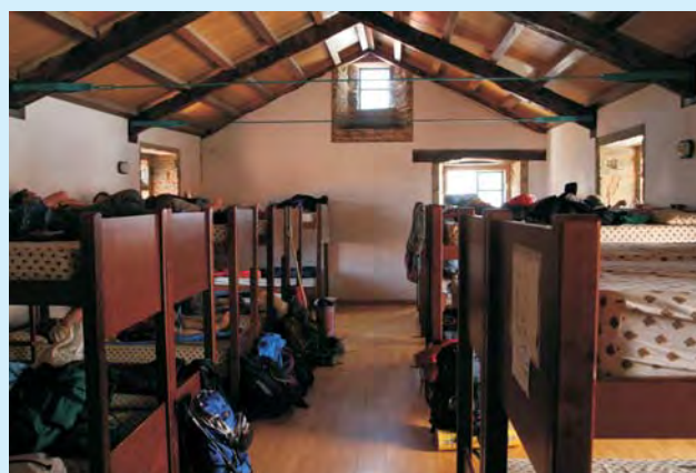
Pielgrzymi są osobno na trasie, ale nocleg po dniu przemarszu daje poczucie wspólnoty