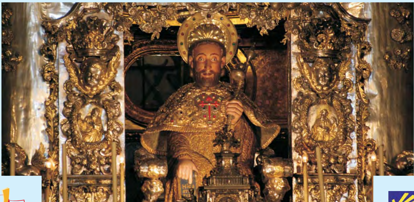
Św. Jakubie – dotarliśmy do Ciebie