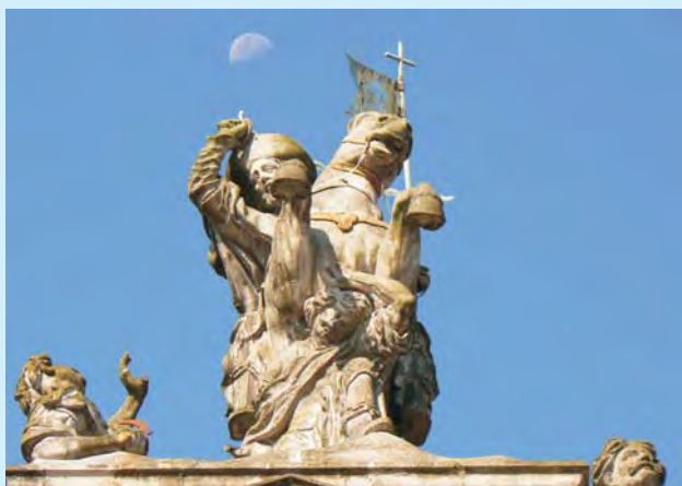
Santiago Matamoros – św. Jakub pogromca Maurów

życia i otaczającego nas zewnętrznego świata. I to jest chyba najcenniejsze. W tle pozostają zmęczenie, ale i wspaniałe katedry, kościoły, pozostałości rzymskich dróg i mostów, liczne wioski i miasta położone wśród winnic, pól uprawnych i lasów, bogactwo i urok krajobrazu.