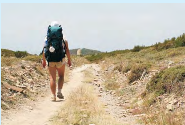
Plecak ciężki, ale nogi prowadzą nieustrudzenie do celu