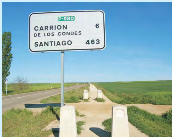
Połowa drogi – czy wytrwamy...

Droga do Santiago – to nie tylko droga „fizyczna” do Composteli z jej brukami, kramami, studniami, gospodami i całym zapleczem powstałym z myślą o strudzonych pielgrzymach. To także wytwory sztuki zaspakajające sferę uczuć i potrzeb wyższych. Od samego niemal początku, oraz przez wieki istnienia szlaków do Santiago, powstało wiele niezwykle uduchowionych, kulturowych i ekonomicznych zysków z ich istnienia; rozkwitała literatura, muzyka, sztuka i historia oraz, co za tym idzie, na trasie rodziły się miasteczka i wsie, budowano domy opieki i schroniska. Zaczęły pojawiać się drogi, mosty, sklepy. Rozkwitała sztuka romańska, planowano i projektowano katedry i kościoły. W XI w. samo miasto Santiago oraz teren, przez który prowadził szlak, jako jeden z niewielu obszarów chrześcijańskiej Europy, przeżywał rozwój ekonomiczny.