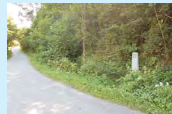
Drogowskaz z muszlą na Małopolskiej Drodze św. Jakuba