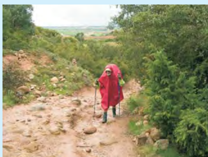
Deszcz nie przeszkodzi pielgrzymom w drodze do celu