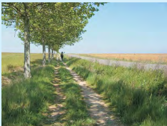
Cień – chwila wytchnienia w pałacy słońcu