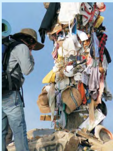
Pamiętki po pielgrzymach na krzyżu w La Cruz de Foncabdon