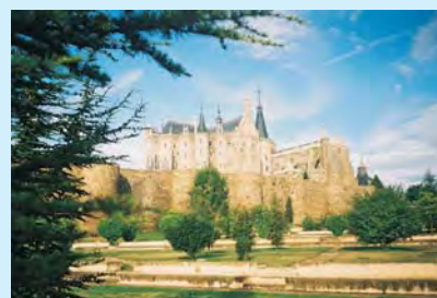
Dziedzictwo przeszłości – Astorga – pałac biskupi dzieło Gaudiego