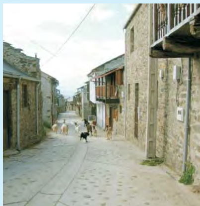
Swojski widok urokliwych hiszpańskich miasteczek