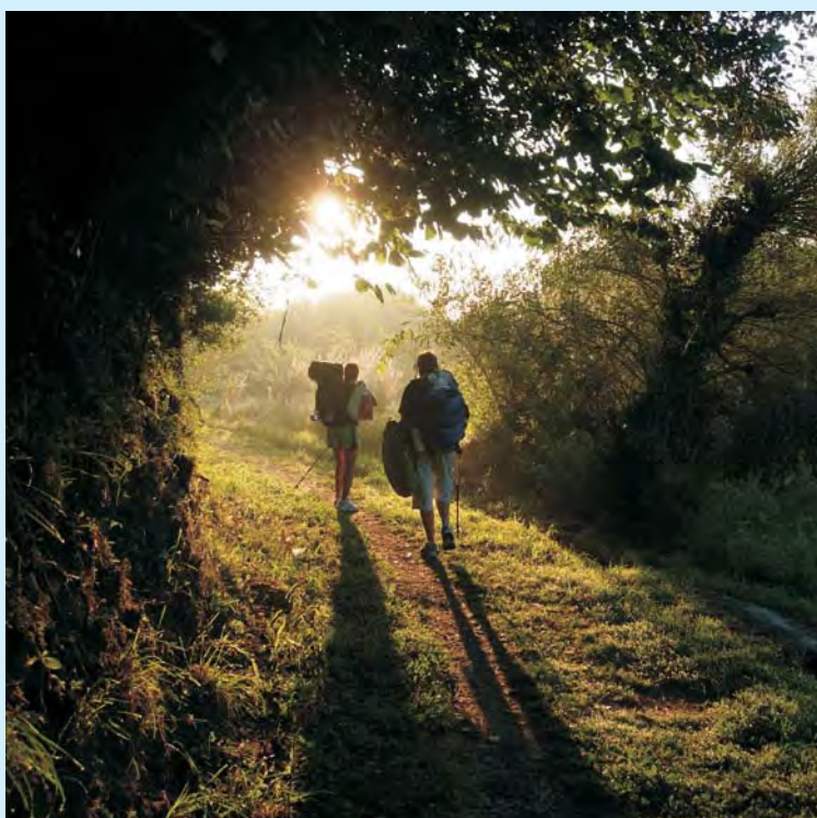
Wschód słońca – mistyka poranka