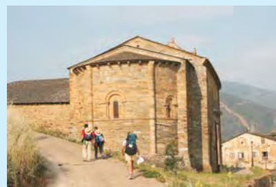
Villafranca del Bierzo – już tu pielgrzymi mogli otrzymać Compostelę, świadectwo przebycia drogi

kułtu św. Jakuba Apostoła Starszego. Fenomen tego pielgrzymowania polegał na tym, że łączyło ono we wspólnocie wiary i ducha ludzi różnych narodowości, pochodzących z różnych krajów, mówiących różnymi językami, reprezentujących różne stany i pielęgnujących różne obyczaje. Wnosili oni swoją odrębność w tę „wspólną drogę”. Chęć odwiedzenia i modlitwy przy grobie jednego z 12 Apostołów, od średniowiecza, aż po czasy współczesne, tworzy niezwykłą legendę, która fascynuje, łączy i jednoczy pielgrzymów z całego Starego Kontynentu, a również i świata.