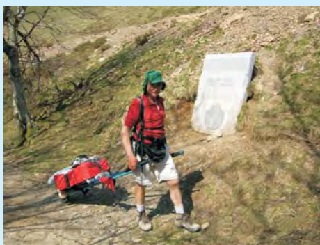
Każdy w inny sposób przenosi swój bagaż – na plecach, w wózku, na rowerze i ...w sercu