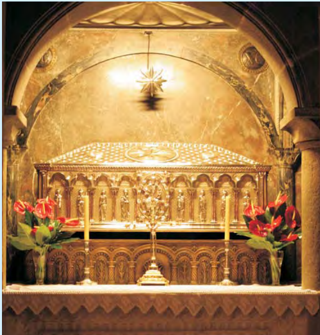
To tu złożone są szczątki Wielkiego Apostoła – Misjonarza

Prezentowane na wystawie zdjęcia ukazują piękno i specyfikę Drogi św. Jakuba wiodącej do wymarzonego Santiago de Compostela. Droga ta to różnorodność mijanych krajobrazów – pól uprawnych pachnących lawendą, lasów, widoków górskich, małych uśpionych miasteczek, gdzie czas płynie leniwie i wspaniałych dzieł architektonicznych. Ale również miejsc tych, którzy swe życie pozostawili na zawsze na Jakubowej Drodzie.