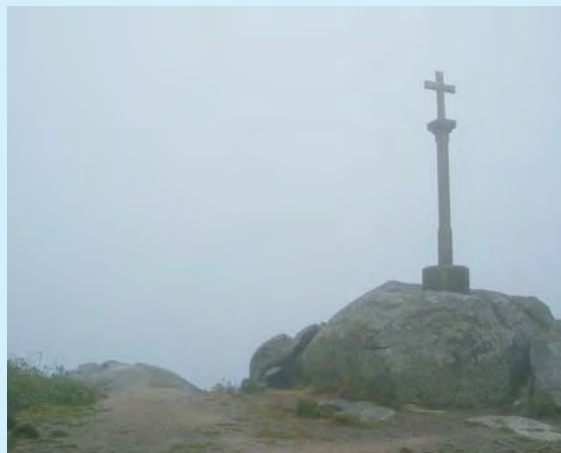
We mgle trzeba szukać prawdziwych drogowców

W roku 1987 Rada Europy, doceniając znaczenie tego średniowiecznego traktu, powołała do życia Europejski Szlak Kulturowy wiodący do Santiago de Compostela. Od tego momentu w różnych krajach zaczęto odtwarzać piesze szlaki prowadzące do słynnego sanktuarium, gdzie znajdowały się relikwie św. Jakuba Ap. St. I tak powstały: „Camino de Santiago”, „Jakobsweg”, „Way of St. James”, „le Chemin de St. Jacques” czy „Cammino di Santiago”.