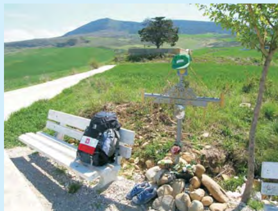
Kolejny pielgrzym, który wieczny odpoczynek znalazł na Drodze