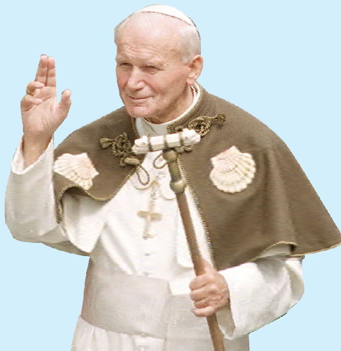
Papież Jan Paweł II ubrany w tradycyjny strój pielgrzyma przed katedrą w Santiago de Compostela; 19 sierpnia 1989 r.

Droga do Santiago uczy pokory, trzeba zmagać się z niewygodą, palącym słońcem, strugami deszczu, pragnieniem, bólem, zmęczeniem. Ale daje ona świadectwo wiary we własne możliwości, daje poczucie spełnienia, satysfakcji, poznania i odnalezienia samego siebie. Kto i dlaczego wyrusza na Camino ? Jedni mają wyłącznie swój cel religijny, inni z ciekawości poznania kraju, jego zabytków, kultury; także spotkanych po drodze ludzi; jako realizację swoich marzeń i pragnień. Jeszcze inni traktują Camino jako wyczyn, jako wyprawę, którą „należy odbyć”. Ale to, co łączy wszystkich, to zdolność do podjęcia wysiłku i widoczna zmiana w postrzeganiu codzienności. Zauważamy nowe wartości – wolność, bezpieczeństwo, braterstwo, ciszę, uśmiech, kolor i barwy otaczającego nas świata, nowy smak upragnionej wody czy podarowanej przez piekarza ciepłej bułki. Jest w człowieku jakaś wewnętrzna harmonia, spokój, dystans do swojego