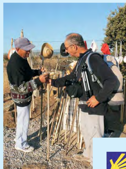
Hiszpańska troska o pielgrzymów