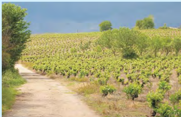
Samotność wśród urodzajnych równin La Rioja i granatowych chmur mknących po niebie