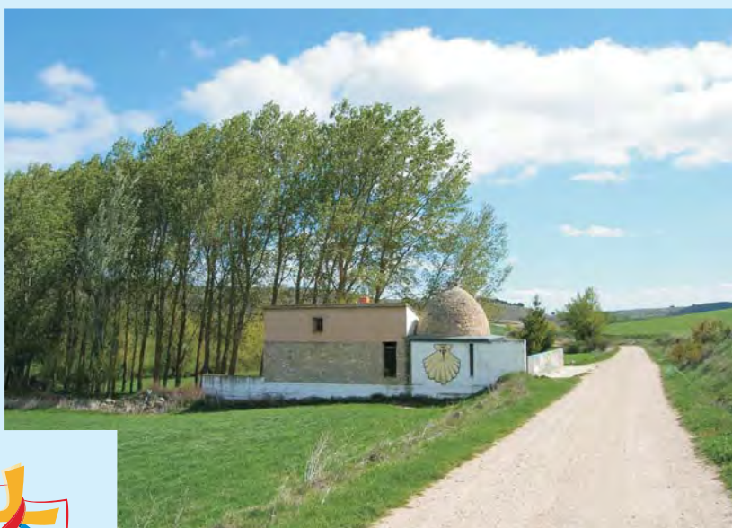
Znak muszli gwarantuje bezpieczne schronienie