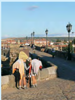
Na moście w Hospital de Orbigo