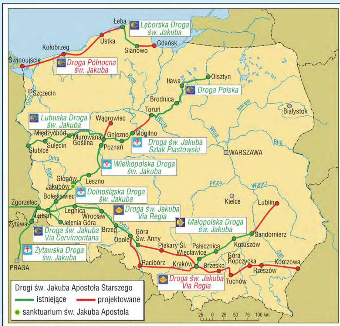
Drogi św. Jakuba Apostoła Starszego w Polsce (stan na 30 września 2008 r.)

W ostatnim czasie do krajów, które reaktywowały drogi Jakubowe dołączyła także Polska. Pierwszym odcinkiem, który został odtworzony, była Dolnośląska Droga św. Jakuba . Powstała ona z inicjatywy Bractwa św. Jakuba Apostoła w Jakobowie oraz „Fundacji Wioski Franciszkańskiej”. Uroczyste otwarcie szlaku nastąpiło 24 lipca 2005 r. Droga Dolnośląska liczy 164 km i łączy się na Moście Staromiejskim Zgorzelec-Görlitz z niemieckim szlakiem św. Jakuba ( Ökumenischer Pilgerweg ).