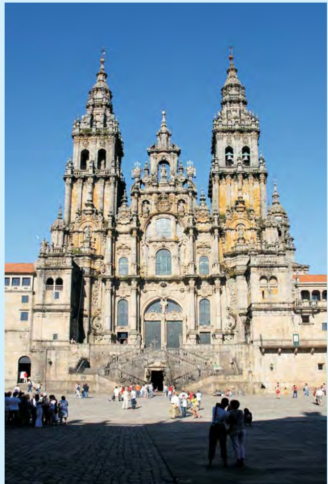
Wymarzony cel – katedra w Santiago de Compostela – fasada Obradorio