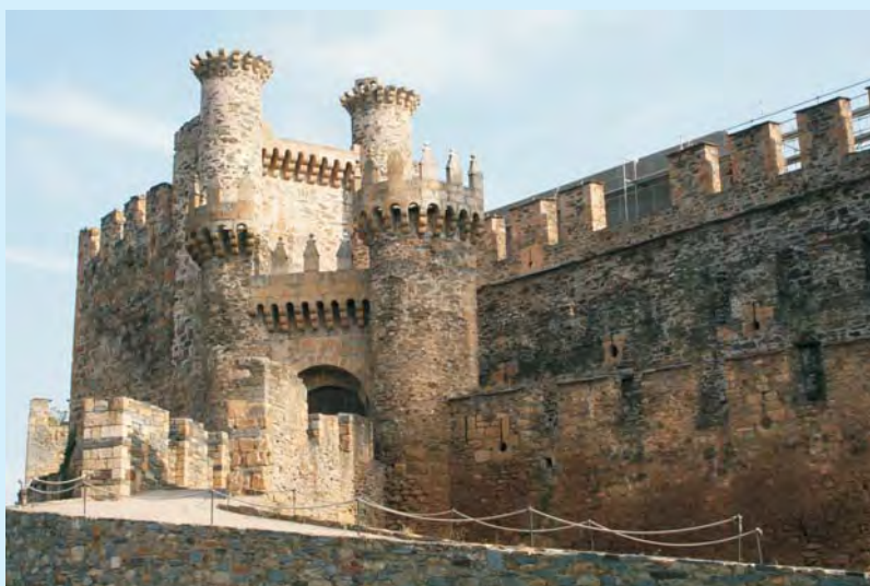
Zamek templariuszy w Ponferrada