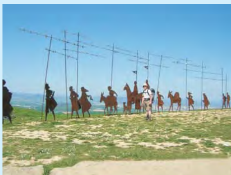
Średniowieczni i współcześni pielgrzymi na Sierra del Pedron