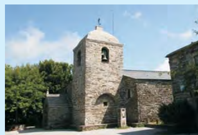
Cebreiro – kościół ze św. Graalem, jego dzwony dawały znak pielgrzymom w górach Galicji